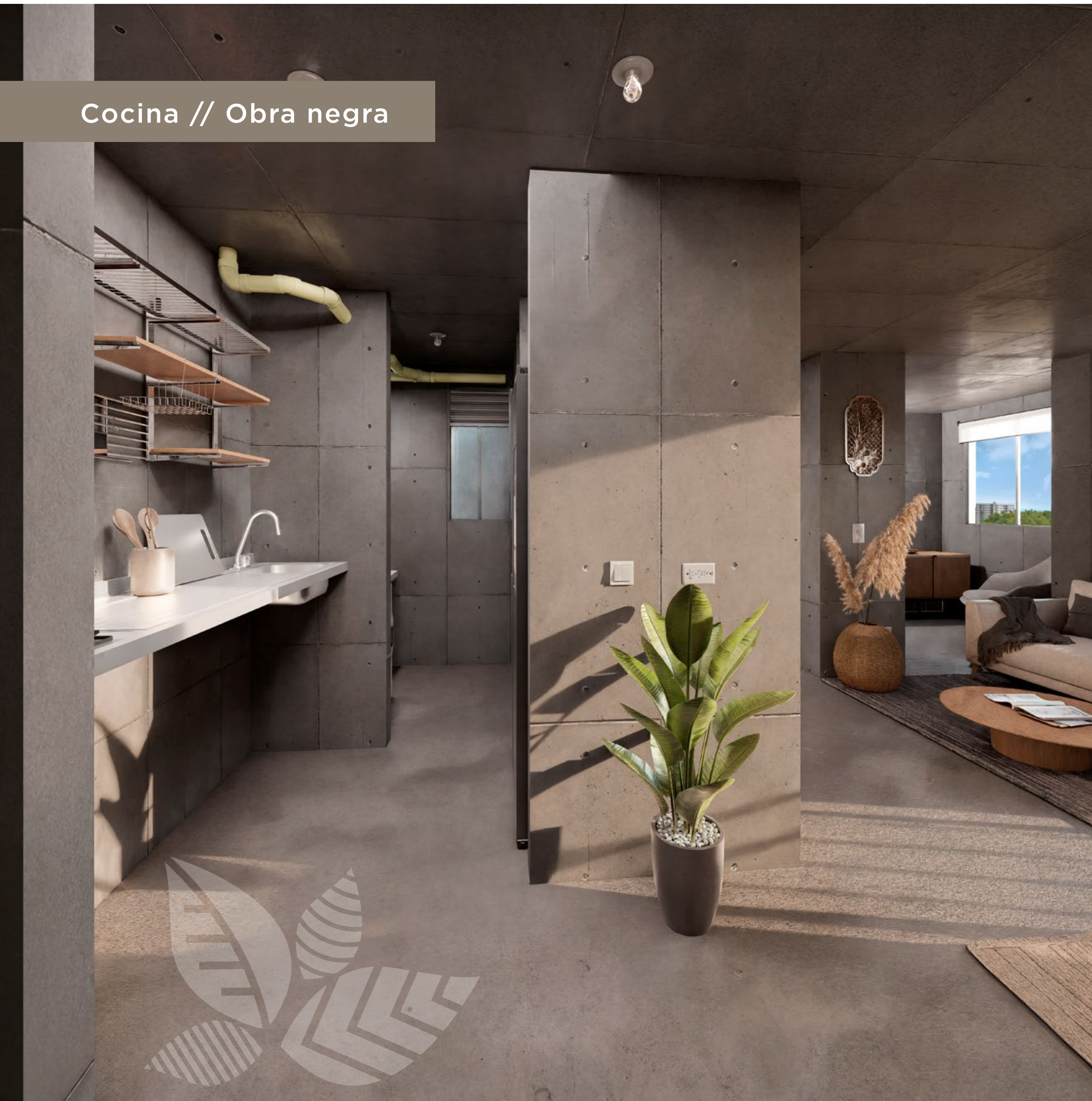
Cocina // Obra negra